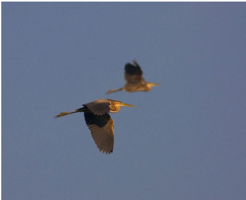
Enorm veel Purperreigers langs de telpost in 2011 (totaal 514), met een nieuw Nederland dagrecord tot gevolg (304 op 30 augustus 2011).

komen de 24 van die ochtend nog bij, waardoor het nieuwe record 414 Blauwe reigers is geworden! Verder ook maar weer eens 58 Purperreigers deze avond. Nu al de Nederlandse records van Koereiger (7 op 20 augustus 2010), Grote Zilverreiger (66 op 16 december 2007) en nu dus ook Blauwe- en Purperreiger in onze handen zijn, kunnen we telpost de Dordtse Biesbosch gerust dé reigertelpost van Nederland noemen!