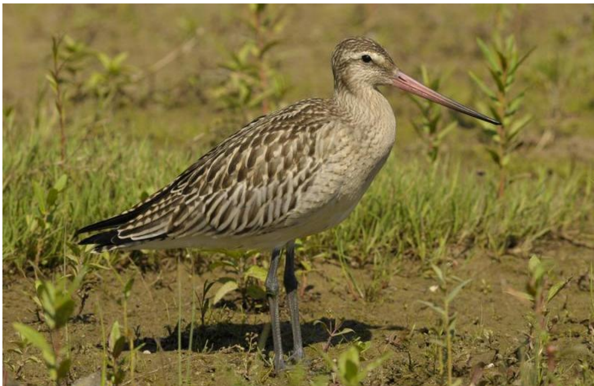
Rosse grutto - 1/9/2011 – Aakvlaai

Op vijftien september werden vijf Geelpootmeeuwen gezien in de Beatrixhaven van Werkendam (AJ). Deze haven bleek in het najaar een fijne trekpleister voor grote meeuwen. Een volwassen Dwergstern werd op de 7 e en de 10 e waargenomen in polder Hardenhoek; een leuke soort voor het gebied (EM, AS). Op de 19 e werden twee Reuzensterns gezien boven het Gat van den Kleinen Hil door PM. In de categorie harde soorten voor het gebied valt ontegenzeggelijk de juveniele Kleine jager , die op de 10 e langs telpost de Dordtse Biesbosch vloog [zie ook het overzicht van de telpost zelf]. De enige Draaihals van dit najaar werd op de 9 e gefotografeerd langs de Veerweg (TP). Andere fijne zangvogelsoorten waren de Roodkeelpieper op de 16 e over polder Happenhennip, een Grote pieper op de 25 e over Werkendam (beide PV) en een Geelgors op de 24 e over het Reeland in Dordrecht (MK). Drie Bladkoninkjes werden er in deze maand al gezien. Een hele vroege op de 18 e in de tuin van 'opa Jan' in Hank (JB, JaB). Op de 28 e één in een parkje in Werkendam (JD) en één op de 30 e langs telpost de Dordtse Biesbosch.