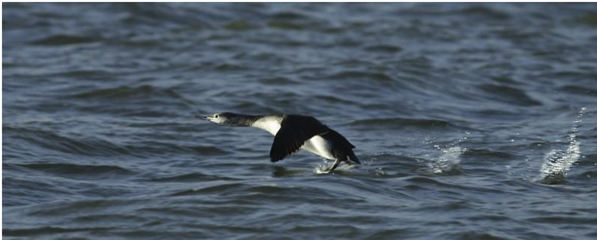
Roodkeelduiker – 30/11/2011 - Hollandsch Diep