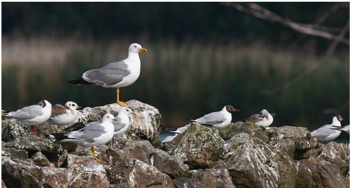
Geelpootmeeuw – 12/7/2011 – Dam van Engeland