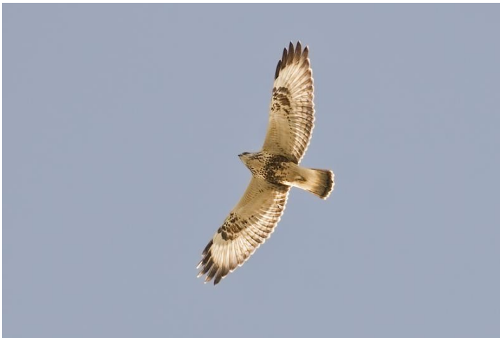
Eén van de 6 Ruigpootbuizerden dit jaar.

In oktober werden een recordaantal van bijna een half miljoen vogels geteld. 1 oktober begon rustig met de 4 e Europese kanarie ooit. 4 oktober leverde de 2 e Kanoet voor de telpost en de laatste Regenwulp ooit voor de telpost. 9 oktober ging het echter helemaal los met in totaal 63.978 vogels van 61 soorten. Geweldig was de bijna constante stroom Vinken en Koperwieken , met daartussen ook veel Zanglijsters . Aan het eind van de dag stond de teller op 35.009 Vinken , een dikke verbetering van het vorige (bijna onhaalbaar geachte) dagrecord van 27.484 op 15 oktober 2003. Koperwieken bleven steken op een zeer goed aantal van 20.813 vogels, maar nog ver verwijderd van het dagrecord van 62.000 op 2 oktober 2007. Van de Zanglijster werden er 4.085 genoteerd (dagrecord 12.500 ook op 2 oktober 2007). Verder deze dag ook 4 Smellekens , 3 Zilverplevieren , 152 Witte kwikstaarten (dagrecord, was 73 op 13 oktober 2003), 62 Grote lijsters (dagrecord, was 42 op 11 oktober 2010), 5 Beflijsters , 223 Kneuen (dagrecord, was 140 op 5 september 2010) en een late Lepelaar en zeer late Boompieper .