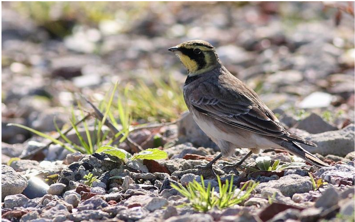
Strandleeuwerik – 15/10/2011 – Beatrixhaven, Werkendam