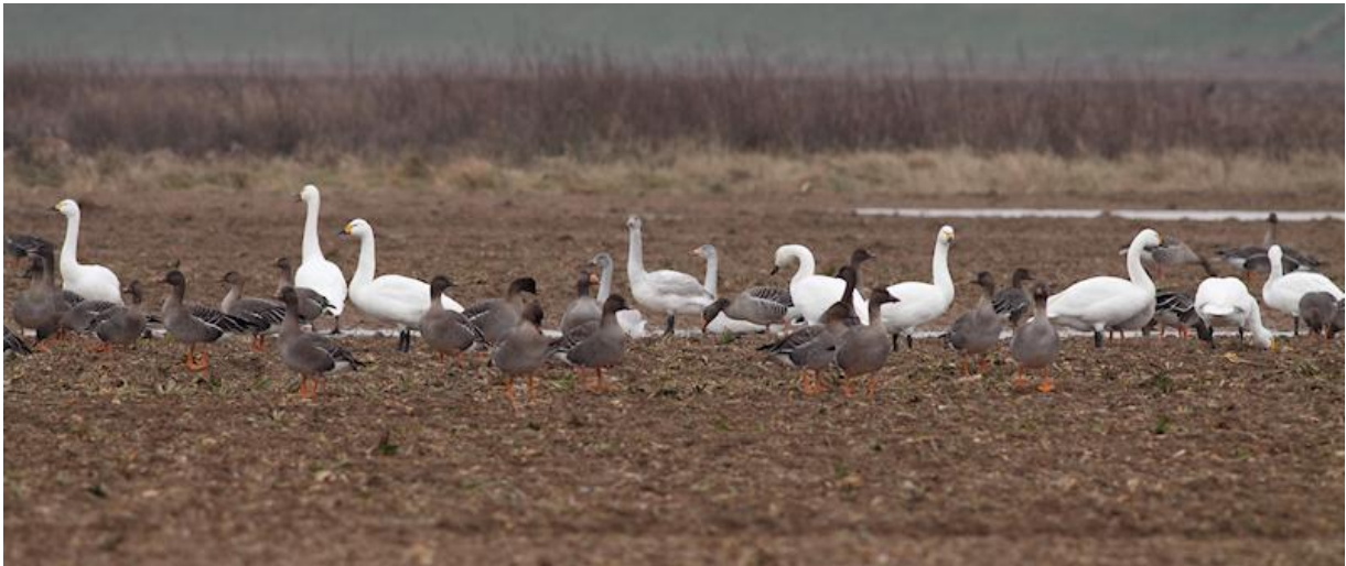
Het jaar begon met enorme aantallen ganzen, Kleine en Wilde zwanen in de Noordwaard.

door Albert de Jong, Theo Muusse en Thomas van der Es