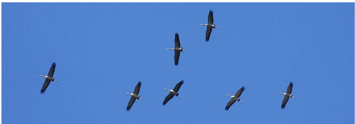
Een groepje van zeven Kraanvogels vloog over de Sneepkil – 23/3/2011

De vroegste zwaluw van de Biesbosch betrof ook dit jaar de Oeverzwaluw . De vogel werd waargenomen in polder Hardenhoek op 12 maart (JD, TE). Samen met een waarneming op telpost Breskens betrof het hier tevens de eerste waarneming dit jaar van de soort voor Nederland. Tot 16 maart verbleven maximaal 4 Pestvogels in de wijk de Hoven in Dordrecht (div). In het Wantijpark in Dordrecht werd op 13 maart een Kleine barmsijs waargenomen (TM). Op 17 maart werd de tweede Rode wouw van maart voor de Biesboschregio waargenomen: een exemplaar vloog over de recreatieplas van de Kurenpolder nabij Hank (MR). Een tweetal Roodkeelduikers en een Middelste zaagbek vlogen op 26 maart over telpost de Dordtse Biesbosch (BV). De eerste goede steltloperdag voor polder Hardenhoek bleek 27 maart te zijn. De hele maand verbleven er al mooie grote groepen (IJslandse) grutto's in het gebied, maar de diversiteit ontbrak. Op 27 maart kwam daar verandering in en werden grote groepen Bontbekplevieren (158), Drieteenstrandloper (2), Kanoet (1), Zwarte ruiter (3) en de 5e Strandplevier voor de Biesbosch in deze polder waargenomen (TM, TE).