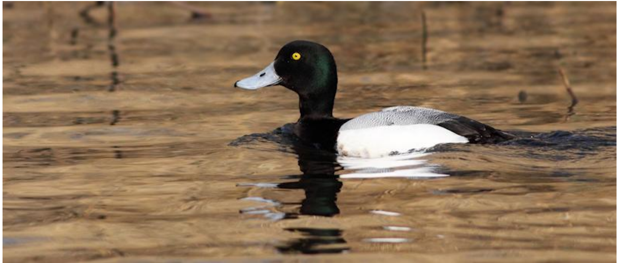
Topper – 15/3/2011 – Spieringsluis

Op diezelfde 8 maart werden ook de eerste Lepelaars opgemerkt en trokken er veel Grutto's over het gebied (654 over telpost Dordtse Biesbosch). Ook passeerde een Kruisbek de telpost (ST, BV, MV). Een fraai mannetje Topper verbleef vanaf begin maart tot 16 maart nabij de Spieringsluis aan de Brabantse kant (div). Het tweetal Kuifduikers van het Gat van den Kleinen Hil verbleef daar tot 15 maart.