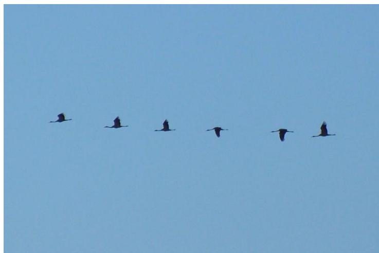
Kraanvogels over de telpost.

Na een rustig begin van maart kwam de trek op de 6 e goed op gang met onder andere een groepje van 3 Nonnetjes , direct een verdubbeling van het aantal waarnemingen sinds 2003 op de telpost. Verder wederom 2 Middelste zaagbekken , 74 Pimpelmezen , 597 Sijzen en een Witkopstaartmees (een restantje van de invasie van 2010, toen we er in totaal 20 mochten noteren). Verder ook de eerste en enige Wilde zwanen (7) van 2011. Een groepje adulten dat