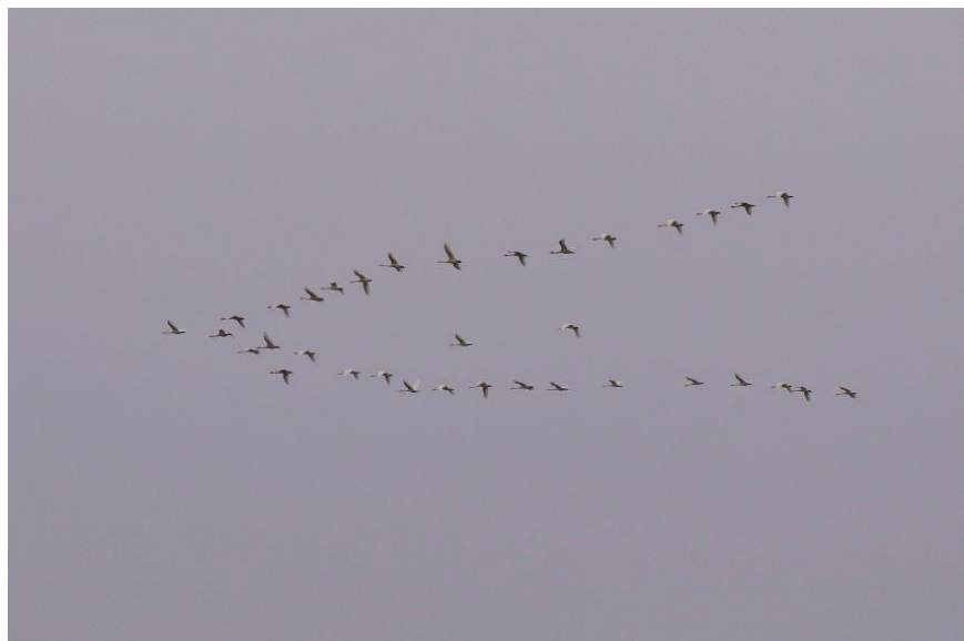
Een groep van 35 Kleine zwanen vliegend langs de telpost.

4 de Roodkeelduiker van het jaar, een jaar geleden was dit nog een nieuwe telpostsoort. En nu met Roodkeelduikers , Parelduikers en een Ijsduiker op de tellijst is het wachten op die laatste duiker om het kwartet compleet te krijgen.. 18 december leverde nog 44 Kleine rietganzen op, waarmee het jaar werd afgesloten.