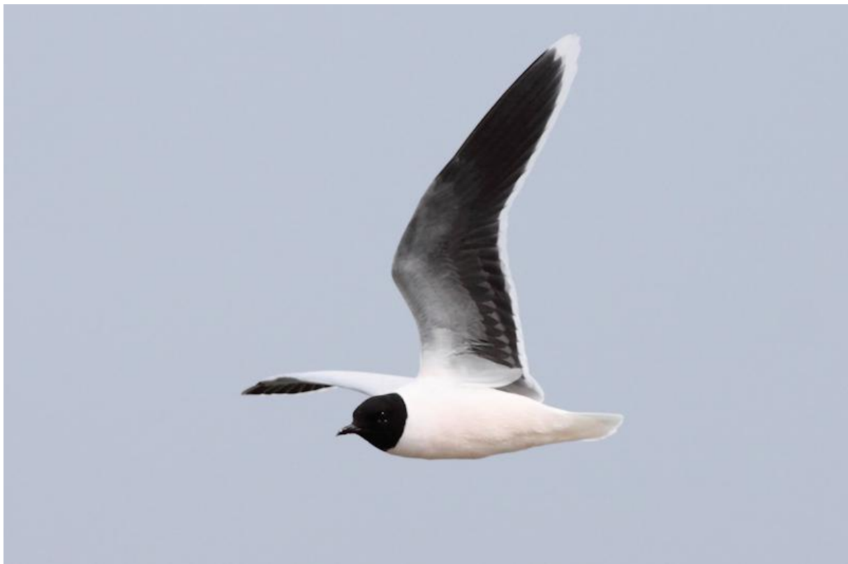
Eén van de 788 Dwergmeeuwen die deze dag over polder Hardenhoek vloog– 27/4/2011

Op 6 april verbleven 2 Kuifduikers op spaarbekken de Grote Rug te Dordrecht (MK). Nog steeds een zeer schaarse doortrekker, een Grote stern , vloog al roepend op 10 april over polder Maltha (TE). De 11 e van de maand verbleef een fraaie Bonte vliegenvanger op Jeugddorp in Dordrecht (MK). De tevens zeldzame Fluiter zong op 13 april op de Hofmansplaat in de Brabantse Biesbosch (TM, TE). De hele maand april was goed voor de Reuzenster ; op 13 april werd het eerste exemplaar waargenomen. Op 14 april werd (de?) Amerikaanse wintertaling waargenomen in polder Hardenhoek (TM). Op 16 april in ieder geval vergezeld van een tweede exemplaar (PW, AJ). De laatste dag dat er een Amerikaanse wintertaling werd waargenomen, was 27 april.