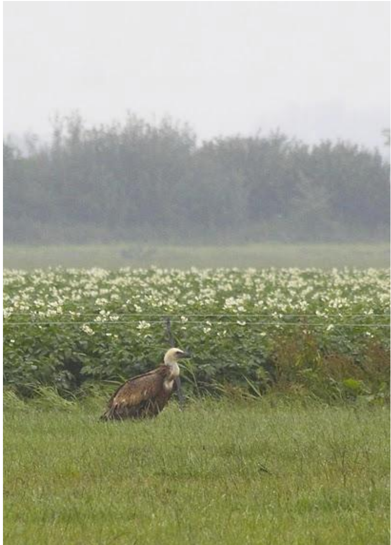
Een bakbeest in de Noordwaard - 25/6/2011

De kraker van de maand werd waargenomen op een regenachtige zaterdag in deze maand, namelijk op 25 juni. Langs de Galeiweg in de Noordwaard werd een Vale gier waargenomen tussen de koeien. Adriaan Ouburg publiceerde de foto helaas wat te laat op het web, waardoor de vogel jammer genoeg niet door andere waarnemers gezien is. De vogel is gedocumenteerd en aanvaard.