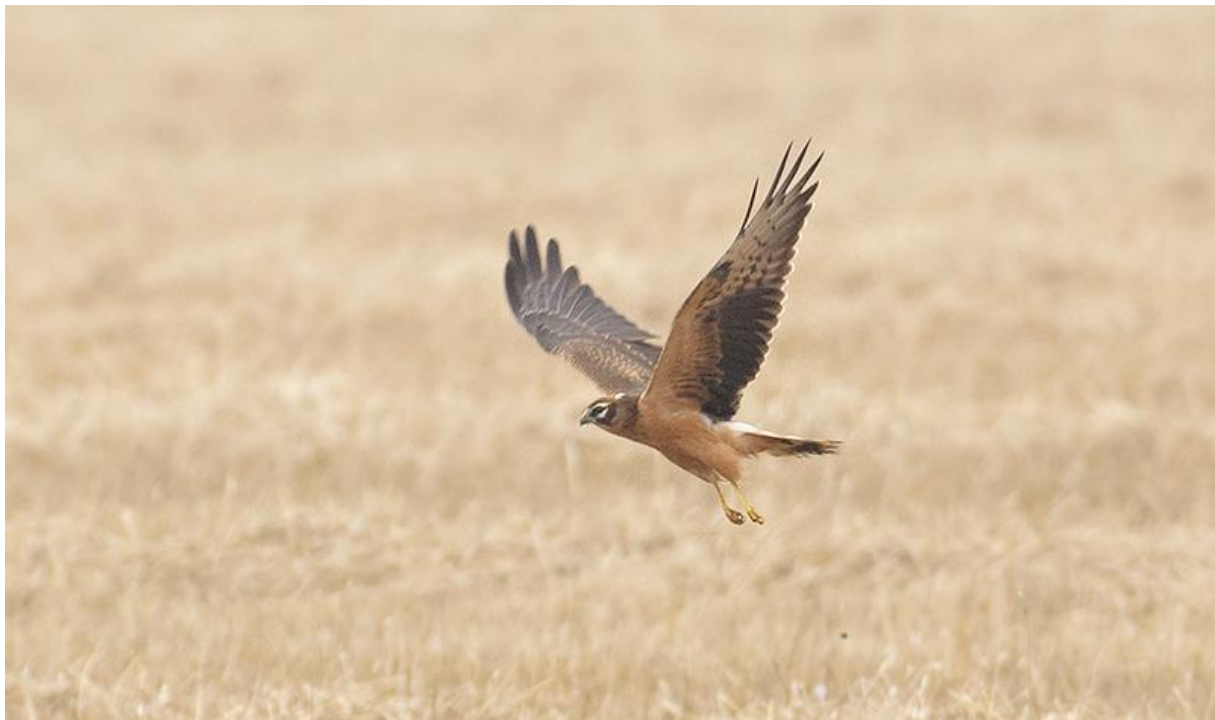
Grauwe kiekendief – 9/9/2011 – polder Keizersguldenwaard

Bijna 5.000 waarnemingen in de Biesbosch werden in deze maand ingevoerd. Daarvan was die van de Buidelmees de eerste opmerkelijke. Deze werd in de eerste week in de Beneden Spieringpolder gehoord (FO). Op de 10 e werden er twee erg goed gezien in de Boven Spieringpolder (AK, JV). Duinpiepers blijven hier een zeldzaamheid. Op de 1 e werd een exemplaar gezien op de Moordplaat (JaB, JB). Onbevestigd bleef de waarneming van een Raaf op diezelfde dag in de Middelste Kievitswaard (HR). Een fraaie, juveniele Grauwe kiekendief werd op de 2 e ontdekt in de omgeving van de Galeiwaard, waar deze tot zeker de 13 e door velen werd gezien (PV). Waarschijnlijk dezelfde vogel werd op 18 september voor het laatst gezien in polder Hardenhoek (WA). Op de 2 e werd eveneens melding gemaakt van een zekere onvolwassen Steppekiekendief langs de Deeneplaatweg (BaV). Bijna zeker was de waarneming van een juveniel vrouwtje van deze soort over telpost de Dordtse Biesbosch op de 30 e (HG, ST). Maximaal drie Casarca's werden deze maand gezien in polder Hardenhoek (WT). Jaarlijks terugkerend zijn de Krooneenden . Vanaf de 4 e werd een vrouwtje gezien in polder Hardenhoek (JaB, JB). Op diezelfde dag vloog een Zwarte ooievaar over het Boomgat (HE). Op de 5 e noteerde JD twee mooie aantallen in polder Hardenhoek: hij zag er zeker 100 witte kwikstaarten en ruim 1.000 oeverwaluwen .