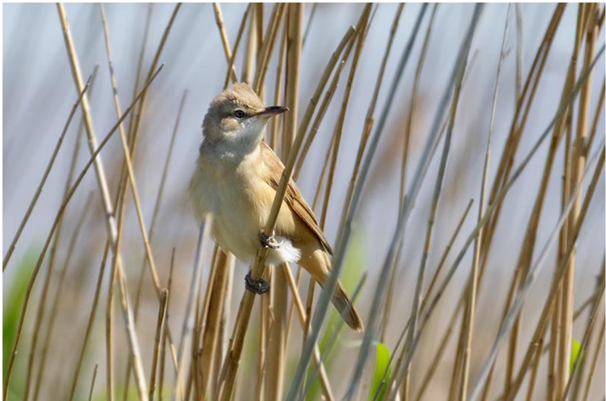
Tegenwoordig is de Grote karekiet niet eens een jaarlijkse gast – 3/5/2011 – polder Hardenhoek

De eerste Witwangstern van het jaar vloog op 3 mei (TE, HG) en 4 mei (JdJ en ToM) boven de Hardenhoek en in de avond van de 4 e boven spaarbekken de Grote Rug (ST, MK). De tegenwoordig erg schaarse Grote karekiet zong op 3 mei hard genoeg voor HG om bij het laarzenpad van polder Hardenhoek ontdekt te worden. De tweede Witwangstern vloog uiteraard over telpost de Dordtse Biesbosch op 5 mei. Roodpootvalken blijven een zeldzame verschijning bij ons. De langsvliegende vrouw op 5 mei over de Hardenhoek (HG) en de vrouw langs de Dordtse telpost op 6 mei (MV, ST) werden dan ook jubelend uitgezwaaid. Het is ook de dag dat een Grote karekiet zich kortstondig nabij Kindem liet horen (MR).