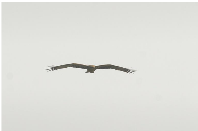
Veel wouwen dit voorjaar (8 Rode en 5 Zwarte). Hier één van de Zwarte wouwen.

April begon goed met op de 2 e een Rode wouw , een Smelleken , 6 Torenavalken , 10 Kluten , een Boomklever en een Buidelmees . De dag erna volgde weer een Rode wouw en de eerste Visarend van het jaar. Op 9 april vloog weer een Middelste zaagbek langs. Op 10 april volgden de vroegste 2