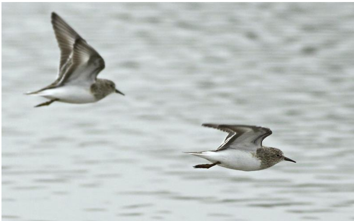
Opvliegende Temmincks strandlopers– 19/5/2011 – polder Hardenhoek

De Hardenhoek bleef maar goed, met op 16 mei weer eens een Poelruiter (TM), 11 Zilverplevieren en 11 Temmincks . Op 19 mei was het miezerig met een noordenwind: ideaal voor steltjes en sterns, ideaal voor de Hardenhoek. TE zag tussen de Dwergmeeuwen een Noordse stern , nog altijd een erg zeldzame soort hier. Tevens die dag leuke steltlopers in de vorm van 23 Kanoeten , 15 Drieteenstrandlopers , 2 Temminckjes , 1 Rosse grutto en 9 Zilverplevieren . Het binnendrijvende slechte weer op de 28 e was goed voor een langverwachte en veel gezochte soort: TE zag in de middag van 28 mei kort maar goed een Roodstuitzwaluw rondvliegen boven de Noorderklip! Door de grote aantallen van Gierzwaluw en Oeverzwaluw kon de vogel niet lang gevolgd worden. Die dag was al goed voor TE daar hij bij de Honderdendertig na lang wachten de door BtK gemelde Roodmus terugvond met MaV.