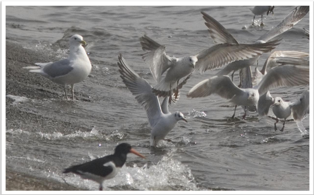
Kumliens meeuw Larus glaucooides kumlieni – 3 april 2011