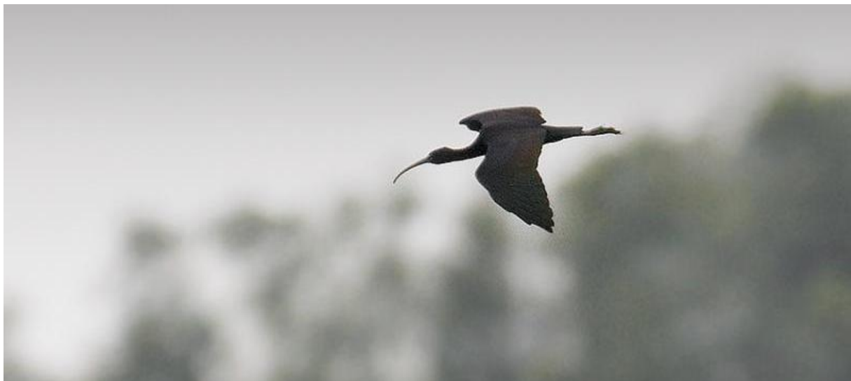
Zwarte ibis – 28/8/2011 – polder Hardenhoek

Begin augustus werd een paartje Steltkluten met twee jongen waargenomen in polder Hardenhoek (JJ). Aangezien het paar ook in juli te zien was, kunnen we aannemen dat het hier om een succesvol broedgeval gaat. Eveneens op een broedgeval duidend waren de waarnemingen van twee volwassen Wespendieven rond polder Maltha en de Reugt. Iedere zomer worden broedverdachte vogels waargenomen; echter is een broedgeval nog nooit vastgesteld. Hoewel op de 21 e een net vliegvlugge vogel werd gefotografeerd in de Kikvorsch of Otter, waarmee een mogelijke primeur werd vastgelegd (SH). Augustus was een goede maand om deze mysterieuze soort in de Biesbosch te zien: circa dertig vogels werden zowel op doortrek als ter plaatse gemeld. De eerste Rode wouw van het najaar werd op 2 augustus in polder Muggenwaard gezien (HG). De eerste weken van augustus verliepen rustig. De leuke steltlopersoorten in polder Hardenhoek bleven helaas wat achter. Op een Kanoet , een Temmincks strandloper , wat Krombekken , vijf Rosse grutto's op de 5 e (JG, RM) en een groepje van elf Steenlopers op de 31 e (AJ, PV) na, was het geen vetpot. Dee Zwarte ibis , die op 27 augustus in polder Hardenhoek werd ontdekt, maakte veel goed (BM). 'Oeverzwaluwen genoeg', moet MR hebben gedacht toen hij er op de 7 e zeker 500 telde boven polder Hardenhoek.