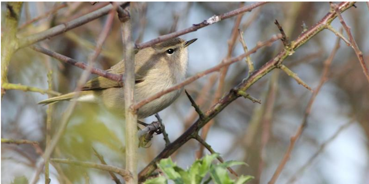
Siberische tjiftjaf – 24/11/2011 – polder Maltha

De maand november was een rustige maand. Pas in de laatste week 'vielen' enkele soorten die bijzonder zijn voor het gebied. Hoewel, op 1 november meldde TM een mogelijke Bastaardarend boven Kruidvlaai. Op 1 november passeerde een Rode wouw de Tongplaat (HG). In november waren er nog zeven meldingen van overvliegende Ruigpootbuizerds in het gebied. Een Roodhalsfuut werd vanaf de 2 e gezien op spaarbekken De Gijster (TM); niet de enige, want op 28/11 was de soort te vinden op de vaste overwinteringsplek: het Gat van de Visschen (TE). De laatste Tapuit werd op dezelfde dag gemeld in polder Hardenhoek (PS). Op 9/11 was een Velduil te zien in polder Hardenhoek (HG, JD). Over deze polder vloog op dezelfde dag de tweede juveniele Kleine jager van dit jaar (HO). Een late Visarend vloog op 11/11 over De Kwellingen bij Werkendam (PV). Op de 12 e hoorde TE een eenzame Kraanvogel 's avonds over polder Maltha vliegen. Het aantal Goudplevieren liep deze maand in polder Hardenhoek op tot 105 op 9/11 (HW). Op 24/11 ontdekte AJ een luid roepende Siberische tjiftjaf bij de kijkhut van polder Maltha. De vogel kon in de dagen erna goed worden bekeken, gefotografeerd en de roep kon worden opgenomen. Het betrof het eerste goed gedocumenteerde geval voor de Biesbosch en het tweede geval voor Noord-Brabant. Twee winters terug werd deze soort kortstondig gezien langs de Hilweg (TM) en ook in 2004 en 1995 waren er claims in het werkgebied.