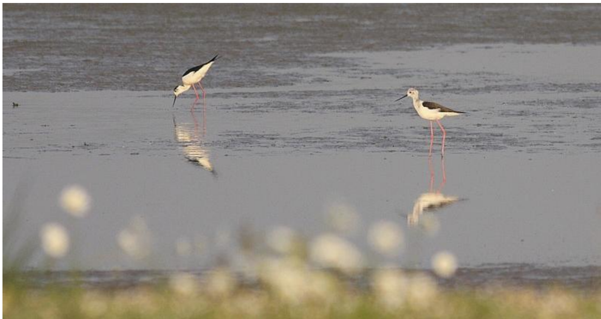
Een paartje Stelkluten zorgde voor broedsucces in de Biesbosch – 9/5/2011

De 18 e van de maand was een erg goede dag voor bijzondere soorten. Langs de Deeneplaatweg zat een Draaihals (MD), een Dwergstern fourageerde in de Hardenhoek (TE) en een Poelruiter werd 's avonds waargenomen in de net ingerichte polder Moordplaat in de Brabantse Biesbosch (TE). Het beloofde een goed jaar voor Stelkluten in Nederland te worden en ook in polder Hardenhoek. De aftrap hiervan vond plaats op 20 april toen er 4 exemplaren werden waargenomen in die polder (AC). Op 21 april vloog er een nieuwe soort voor de Biesbosch over het Gat van de Slek in de Brabantse, namelijk een Slangenarend (TE, LB). Die avond cirkelde er ook nog een Zwarte ooievaar boven de Beatrixhaven in Werkendam (BV). Een vrij vroege Roodpootvalk vloog op 22 april over telpost de Dordtse Biesbosch net als de zeldzame Roodstuitwaluw (MK, ST). Een behoorlijk late adulte Ruigpootbuizerd vloog op 23 april over polder Hardenhoek (EE, TE, ME). Op 27 april werden schitterende aantallen Dwergmeeuwen waargenomen in polder Hardenhoek. De teller bleef steken op 788 exemplaren (TM, AJ, PV, TE). Op 28 april werd de eerste van de maar liefst 6