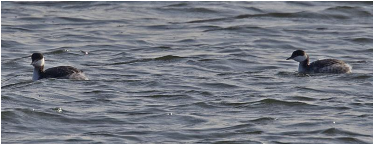
Kuifduikers – 21/2/2011 – Gat van den Kleinen Hil

De eerste Kuifduiker werd gemeld op 7 februari op hetzelfde spaarbekken (TE, TM). Vanaf 16/2 verbleef er ook een exemplaar in het Gat van den Kleinen Hil en vanaf 21 februari werd deze vogel vergezeld door een tweede exemplaar (TE, TM). Drie Kraanvogels werden overvliegend waargenomen op polder Maltha op 16/2 (PD). Een Rode wouw werd gefotografeerd boven de Bruine Kilhaven nabij Werkendam op 19/2 (JG). De waarnemingen van Houtsnippen waren mager te noemen, enkel rond de schemer werden enkele exemplaren op polder Maltha gezien (TE). Een Pestvogel werd roepend waargenomen boven het Vogelplein in Dordrecht op 24/2 (TM).