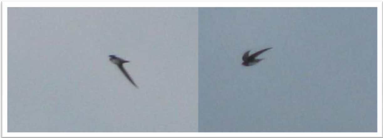
Alpengierzwaluw Tachymarptis melba – 14 mei 2011