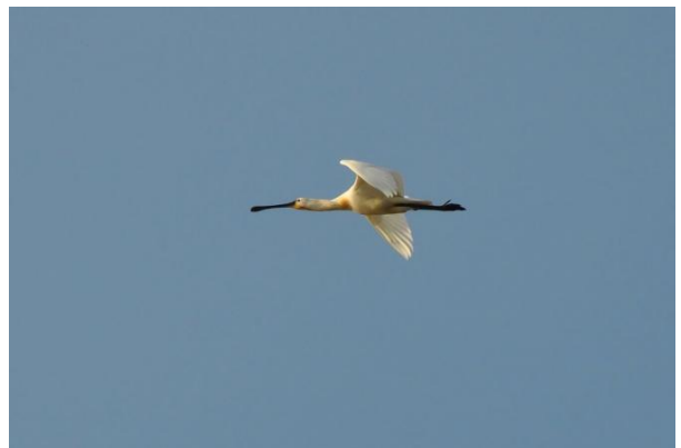
De traditionele oktoberlepelaar.

September begon rustig, maar 10 september was het feest. Er werden onder andere 3 Wespendieven , 8 Bruine kiekendieven , 6 Visarenden en 1 Geelpootmeeuw genoteerd. Hoogtepunt was echter de eerste jager voor de telpost. Ongeveer 2 uur lang vloog er onregelmatig een Kleine jager heen en weer, een nieuwe telpostsoort! Ook 11 september was leuk met onder andere veel Boerenzwaluwen (1.357), een late Koekoek , 2 Visarenden en de eerste Smelleken van het najaar. En de Visarenden bleven het goed doen, want 4 dagen later werden er weer 2 genoteerd. Op de 16 e konden maar liefst 4 Visarenden worden bijgeschreven, net als 1.264 Boerenzwaluwen . De dag erna passeerde alweer de 7 e Roodpootvalk van het jaar de telpost. Op 25 september volgde zelfs de 8 ste Roodpootvalk van het jaar (tegen in totaal 6 in de periode 2003-2010). Deze dag ook een IJsgors , 2 Vuurgoudhaantjes en de eerste Boomleeuwerik van het najaar. 28 september bracht de eerste Kolganzen en Veldleeuweriken , net als een Visarend en een Buidelmees . De laatste dag van september bracht de eerste Kepen en Koperwiek , terwijl bij aankomst de 4 e Bladkoning al voor de telpost zat te roepen. Het hoogtepunt moest echter nog komen. Een juveniel vrouwtje Steppekiekendief liet de 2 tellers verbijsterd achter. Alweer de 3 e , na een vogel op 14 april 2007 en 8 oktober 2009.