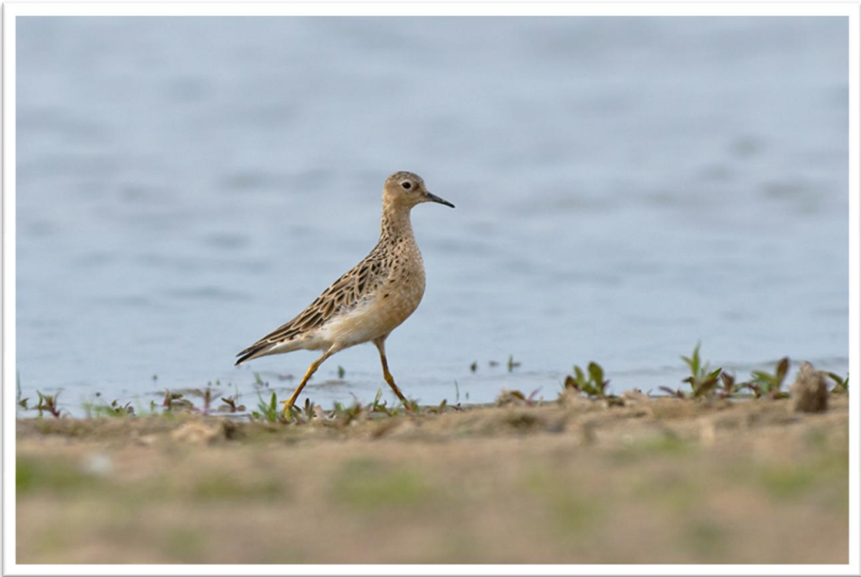
Blonde ruiter Tryngites subruficollis – 13 mei 2011